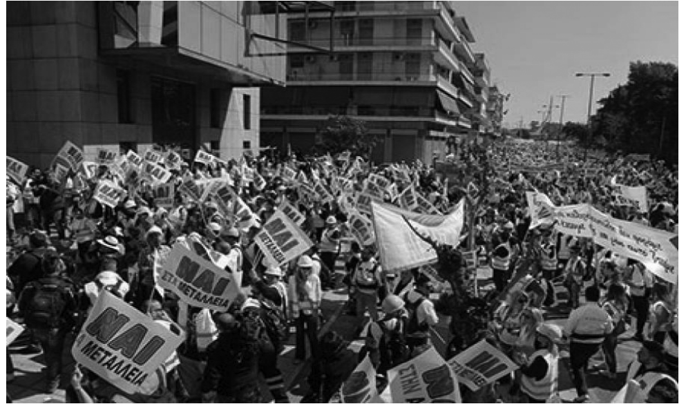
Αφίσα της ΟΑΚΚΕ

Σ υγκλονιστική σε όγκο, αποφασιστικότητα και παλμό ήταν η διαδήλωση των μεταλλωρύχων της Β. Χαλκιδικής στην Αθήνα στις 16 Απρίλη. Ήταν ένας πολιτικός θρίαμβος για τον αγώνα των μεταλλωρύχων, μία πρωτοφανή σε μαζικότητα συγκέντρωση με χιλιάδες εργάτες μόνο από μια περιοχή και ένα εργοτάξιο, που είχε τη μορφή μίας αληθινής εργατικής εξέγερσης με ψηλό επίπεδο οργάνωσης και περιφρούρησης.