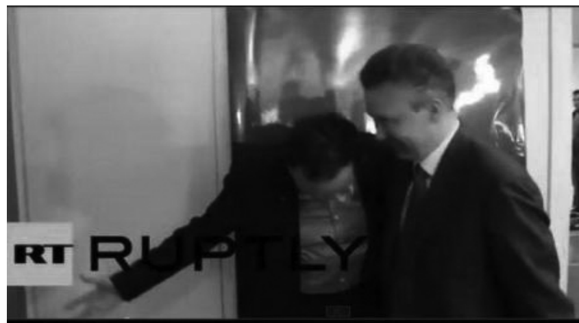
Ο Λαφαζάνης υποδέχεται με δουλικές υποκλίσεις τον πρόεδρο της Γκάτπρωμ Αλεξέι Μίλερ

ΑΠΟ ΤΑ ΠΕΡΙΕΧΟΜΕΝΑ: • Ο Τσίπρας στη Μόσχα: Ανοιχτή προδοσία του ευρωπαϊκού μετώπου αντίστασης, σ. 2 • Όχι στο φασιστικό και καταστροφικό νομοσχέδιο για την παιδεία, σελ. 3 • Ανακοίνωση της ΟΑΚΚΕ για την εργατική Πρωτομαγιά του 2015, σελ. 4 • Ιστορική διαδήλωση των μεταλλωρύχων, σελ. 5 • Η κυβέρνηση των σαμποταριστών συνεχίζει το έργο της, σελ. 8 • Για πρώτη φορά μαζί στο Συμβούλιο Εξωτερικής Πολιτικής, σελ. 10